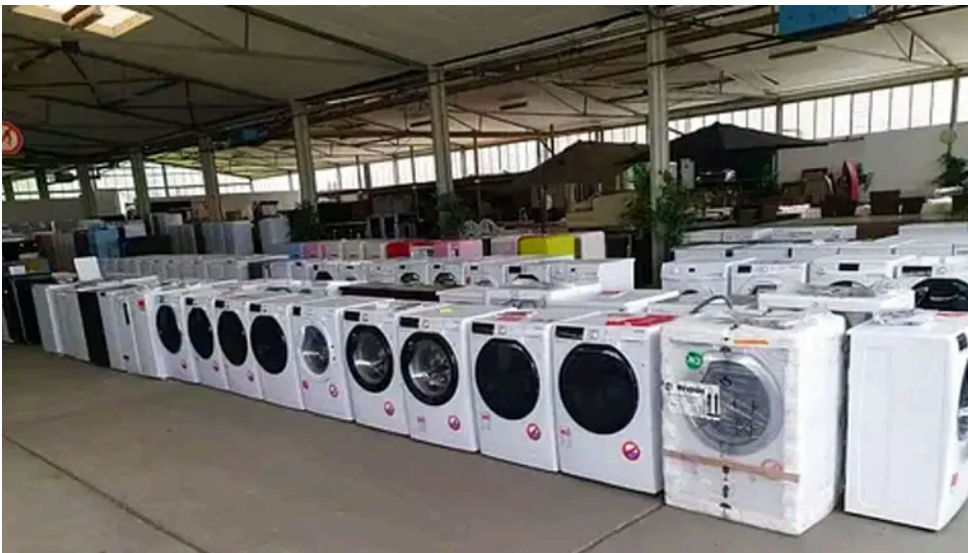
กรุงเทพมหานคร: ขายเครื่องซักผ้าในสต็อกในราคาเกือบแจกฟรี ค้นหาโฆษณา