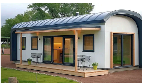
บ้านสำเร็จรูปแบบใหม่ที่ไม่ต้องประกอบ บ้านคอนเทนเนอร์ที่ยังไม่ขายใน Bangkok: ดูราคา! ค้นหาโฆษณา