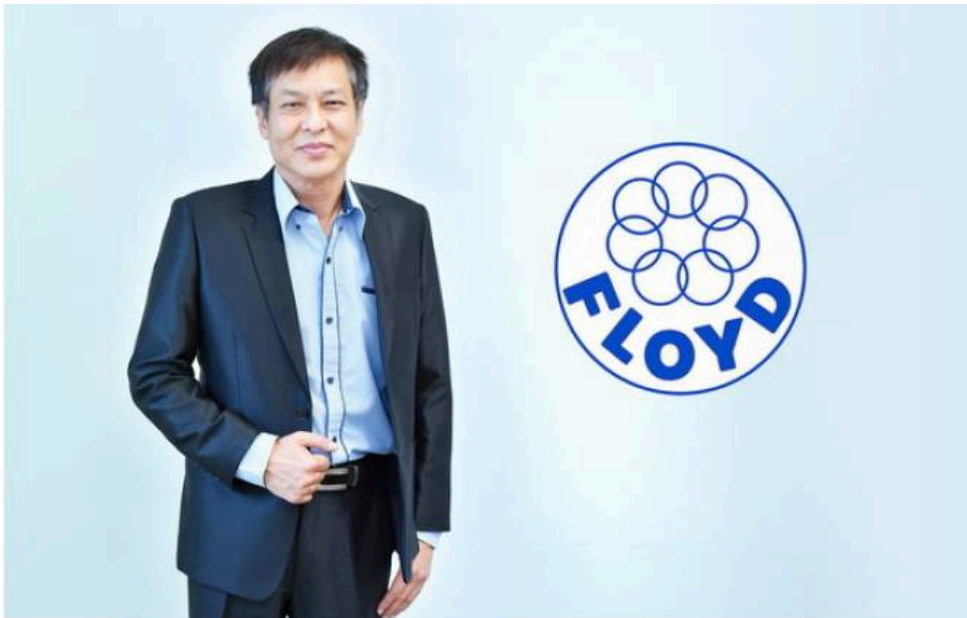
FLOYD โชว์ผลประกอบการ Q2/67 กำไรพีคแรง

ติดตามข่าวด่วน กระแสข่าวน Facebook คลิ๊กที่นี่ ถูกใจ มี 1.5 แसन คนถูกใจสิ่งนี้ ถูกใจเป็นคนแรกในหมู่เพื่อนของคุณเลย