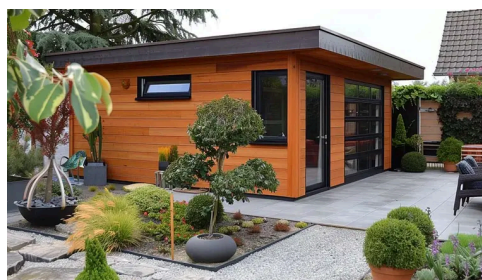
ค้นหาโฆษณา